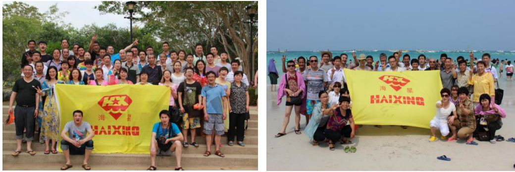
图表6.1-1 员工旅游案例